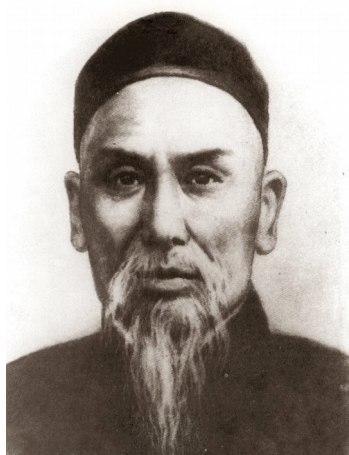
Yang Lu Chan (Fondateur)