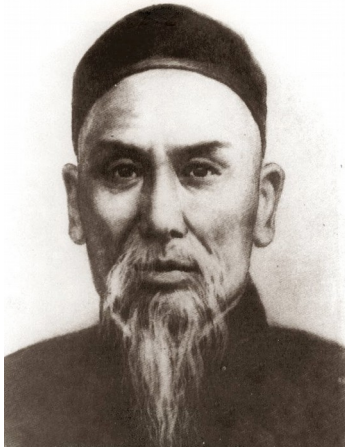
Yang Lu Chan (Fondateur)