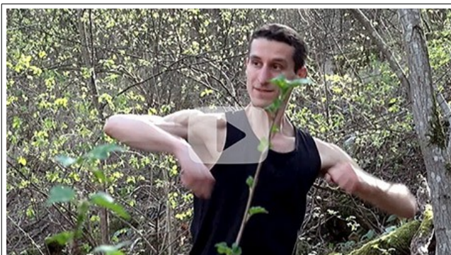
DU MOUVEMENT LENT À LA BOXE

https://www.youtube.com/c/taichibesancon25