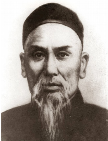
Yang Lu Chan (Fondateur)